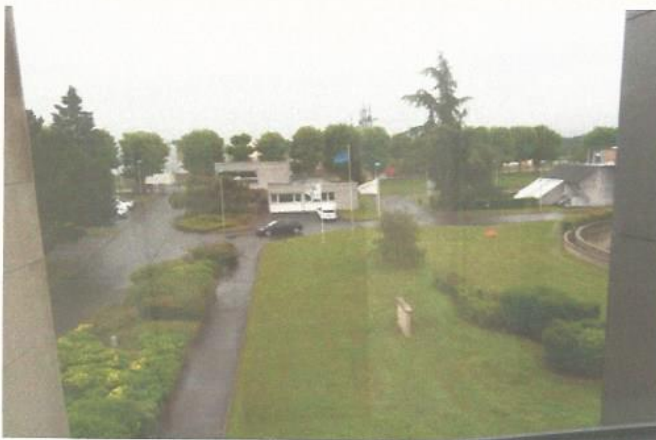
Vue de la station d'épuration actuelle dans son environnement paysager