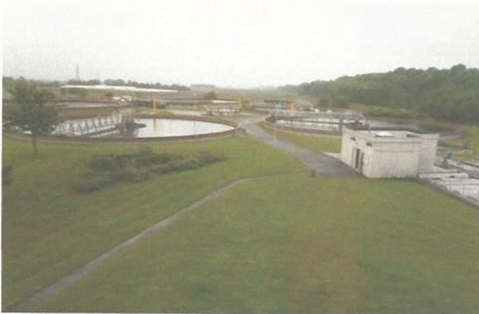
Vue de la station d'épuration actuelle dans son environnement paysager