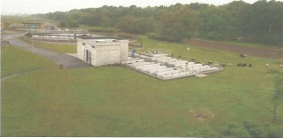
Vue de la station d'épuration actuelle dans son environnement paysager