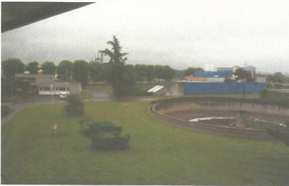
Vue de la station d'épuration actuelle dans son environnement paysager